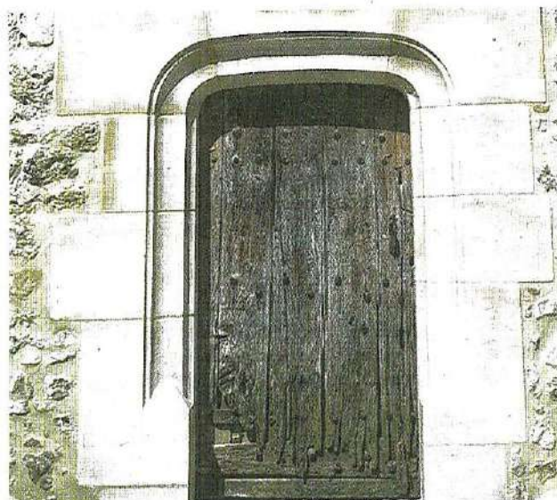
Et après les travaux...

Inscrite aux Monuments Historiques depuis 1928, l'église est longtemps restée sans entretien. Depuis quelques années, la municipalité accueille dans